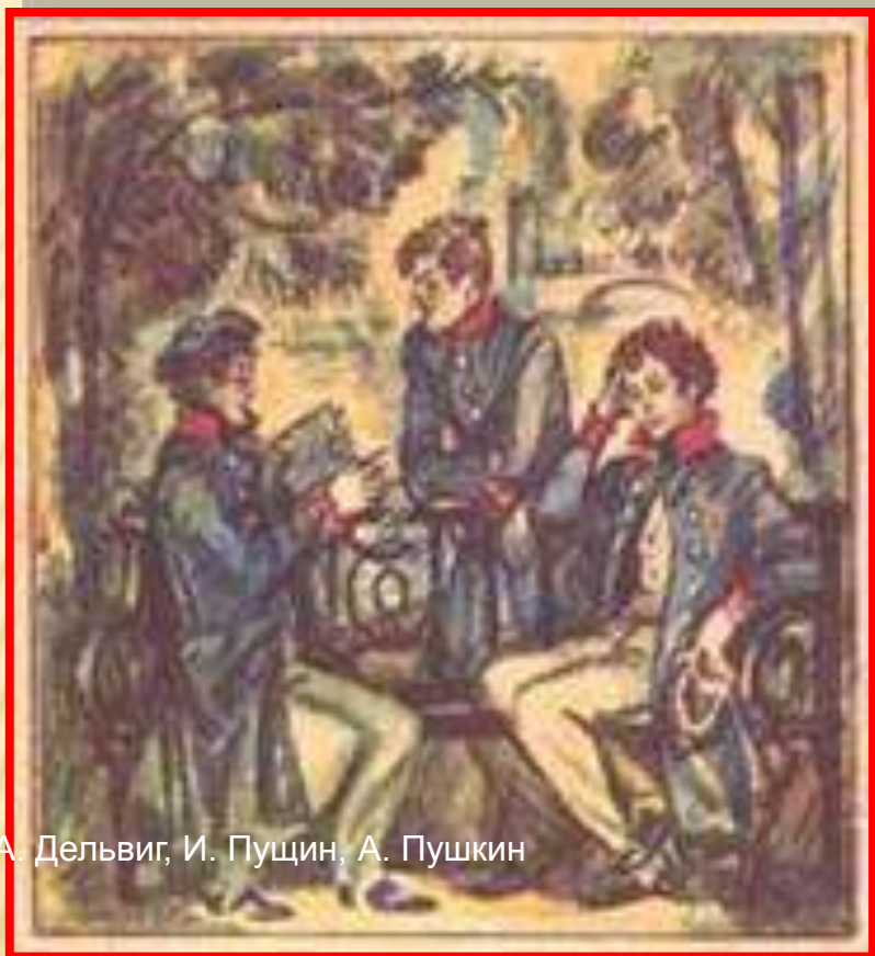
А. Дельвиг, И. Пущин, А. Пушкин